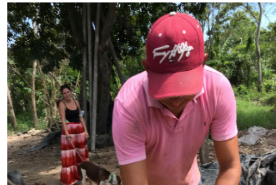
DEIMER AR VALO ALFARER A